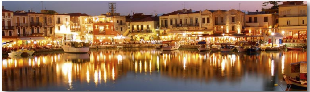
HAFEN VON RETHYMNON

Erleben und bewundern Sie die Schönheiten Kretas mit unserem Ausflugsprogramm und alles mit garantierter Durchführung.